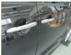
ドアアウターハンドル磨き 小さなキズを落としキレイにします!

日常のカーケアのニーズにお応えする ※1品500円です。「早くて、安く、効果的」なサービスメニューです。