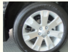
アルミコーティングタイヤワックス ピカピカの足もどってきもちイイ!