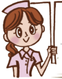
ウインターチェックで点検いたします。

「私のクルマは大丈夫」「最近のクルマは壊れないから」。でもそこには落とし穴がいっぱい。日頃のメンテナンスをちょっとやるかやらないかで、待っているのは天国と地獄です。