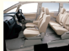
室内消臭 脱臭力に優れた専用液でスッキリ!