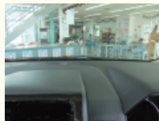
インパネ除菌コート 清潔な室内にしましょう!