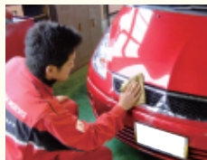
虫取り 落ちにくい虫の汚れをクリーナーで除去します。